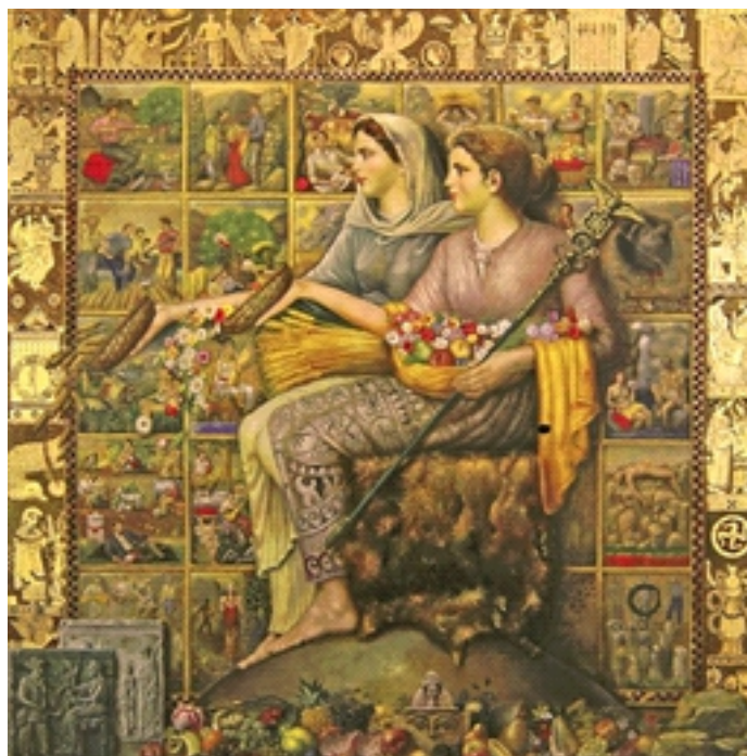
Фреска с изображением богини плодородия Деметры (др.-греч. Δημήτηρ, «Мать-земля») и ее дочери Персефоны из датированного I веком склепа жрицы Деметры, обнаруженного в 1895 году в крымском городе Керчь

Выражение «Богородица мать сыра земля есть» содержится в «пророчестве» мифической «старицы» в романе Достоевского «Бесы» и характерным образом демонстрирует нам саму сущность почвенничества, его установку на «воцерковление» исторически сложившейся религиозной жизни русского народа, то есть заведомо обреченную на неудачу попытку христианизировать языческую составляющую этой «живой жизни». Поскольку христианизировать «народный» пантеизм и антропотеизм (стихийное обожествление мира и человека, физического и социального космоса) средствами ортодоксального Христианства, разумеется, невозможно, подобная процедура «воцерковления» национального язычества осуществляется в почвенничестве средствами гностической демагогии, или религиозной софистики. «А тем временем и шепни мне, из церкви выходя, одна наша старица, на покаянии у нас жила за пророчество: „Богородица что есть, как мнишь?“ — „Великая мать, отвечаю, упование рода человеческого“. — „Так,