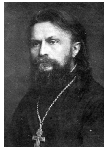
прот. Сергей Булгаков