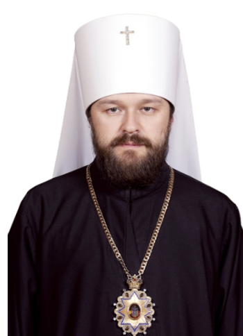
митр. Иларион (Алфеев)