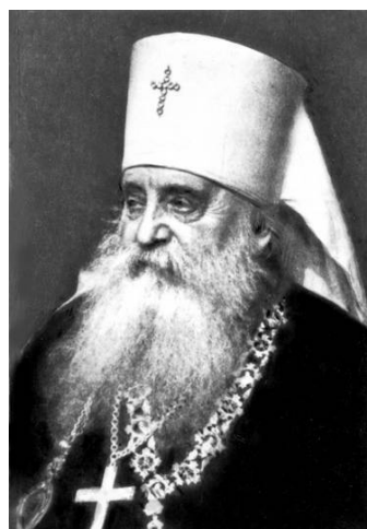
митр. Антоний (Храповицкий)