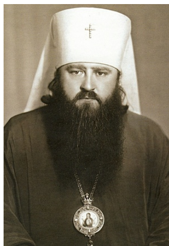
митр. Иларион (Алфеев)