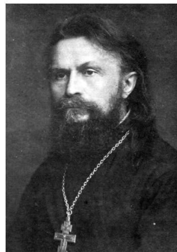
прот. Сергей Булгаков