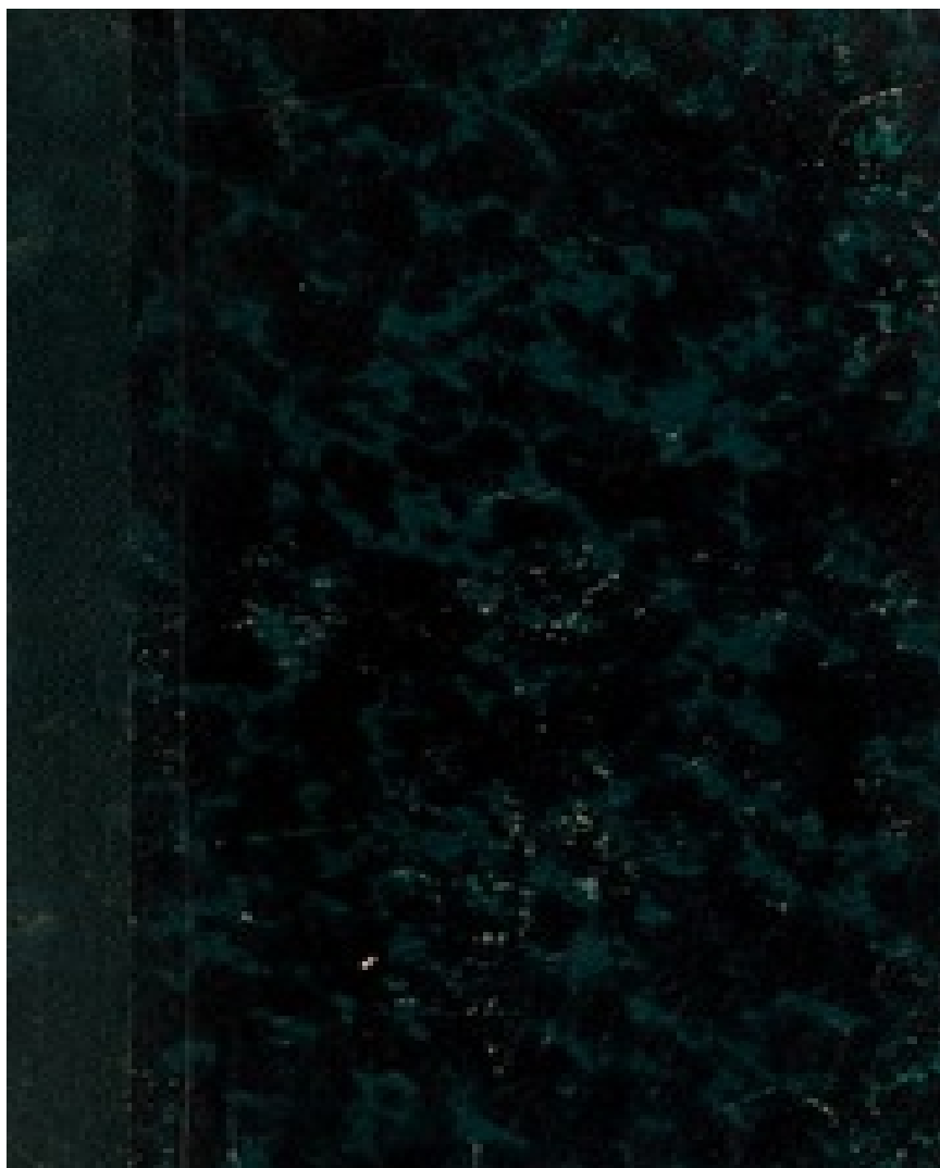
Книга Ф. Ламенне «Слова верующего» (1834) из библиотеки Петрашевского