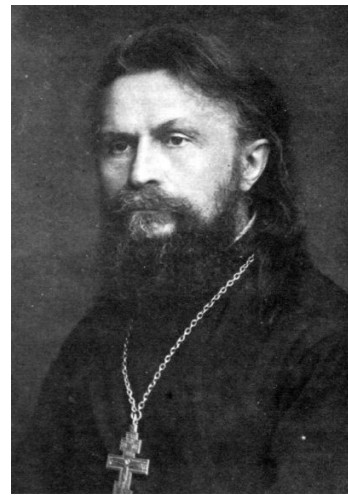
прот. Сергей Булгаков